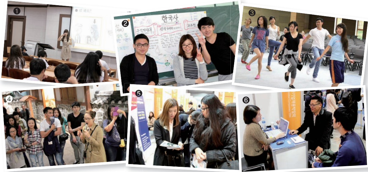
재외동포 모국수학교육과정 운영 관련 사진 자료